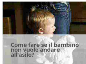
Come fare se il bambino non vuole andare all'asilo?