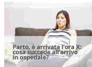
Parto, è arrivata l'ora X: cosa succede all'arrivo in ospedale?