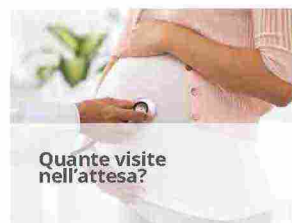
Quante visite nell'attesa?