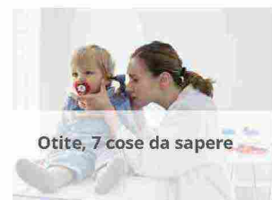
Otite, 7 cose da sapere