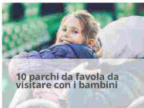
10 parchi da favola da visitare con i bambini