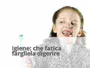
Igiene: che fatica fargliela digerire