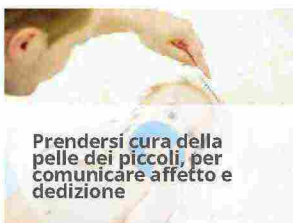
Prendersi cura della pelle dei piccoli, per comunicare affetto e dedizione