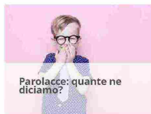
Parolacce: quante ne diciamo?